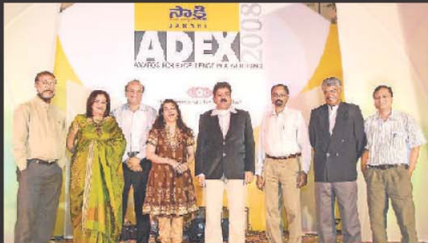
హైదరాబాద్ ఎడ్వర్టైజింగ్ క్లబ్ టెట్ గోయింగ్ బాడీ మెంబర్స్